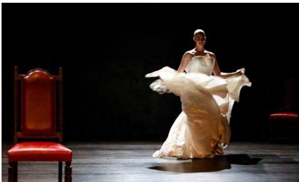
Dans «Opa», la performeuse Méлина Martin interroge l'identité de la plus belle femme du monde, Héléne de Troie. SEBASTIEN MONACHON

Katia Berger / Publié: 07.06.2021, 18h06