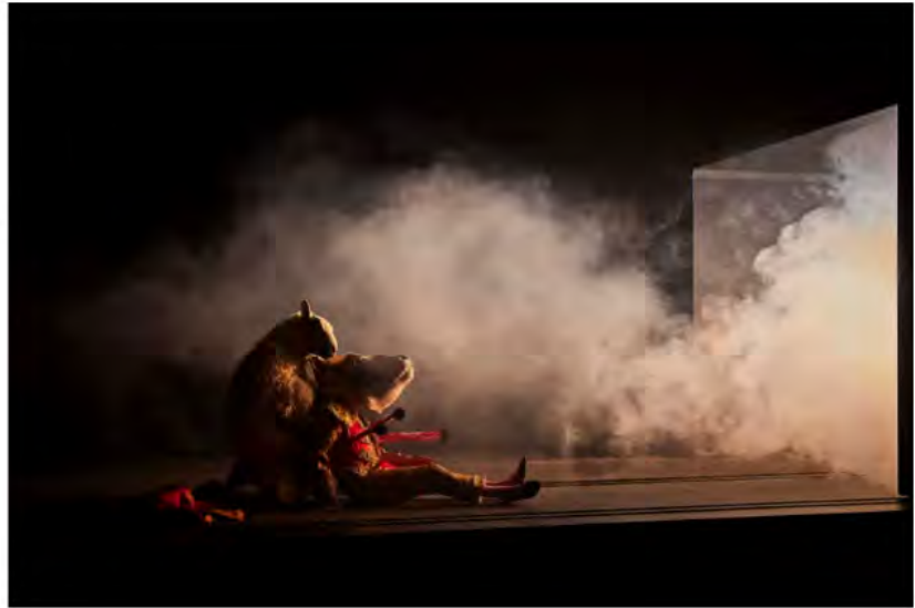
"The Sheep Song", conception FC Bergman

par Igor Hansen-Leve et Philippe Noisette Publié le 21 juillet 2021 à 12h11 Mis à jour le 21 juillet 2021 à 12h11