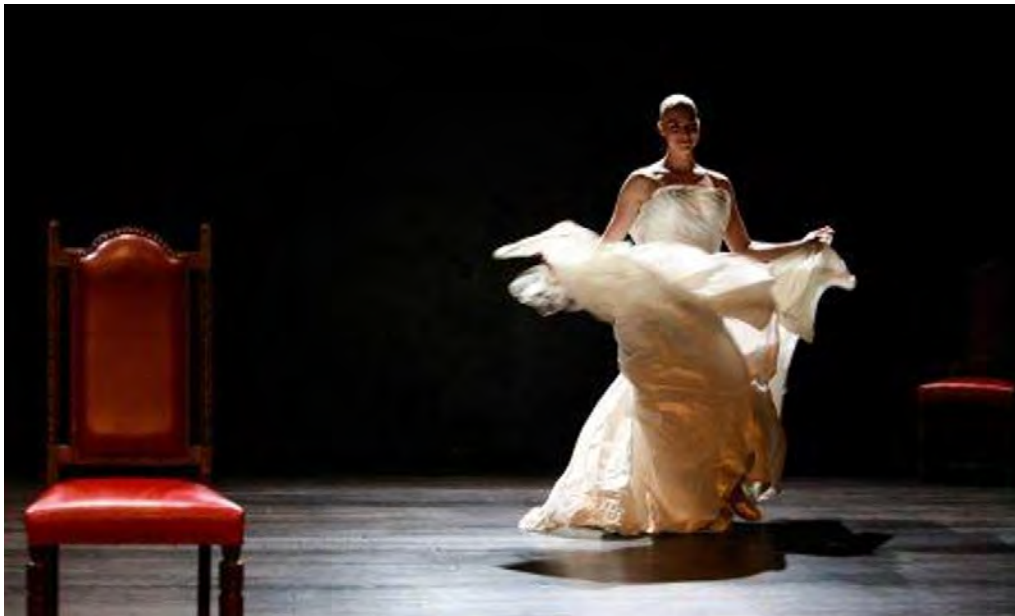
Dans «Opa», la performeuse Méлина Martin interroge l'identité de la plus belle femme du monde, Héléne de Troie. SEBASTIEN MONACHON

Katia Berger / Publié: 07.06.2021, 18h06