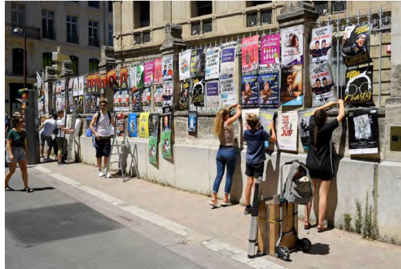
A Avignon, la pose d'affiches et le tractage permettent d'attirer du public au festival "off".